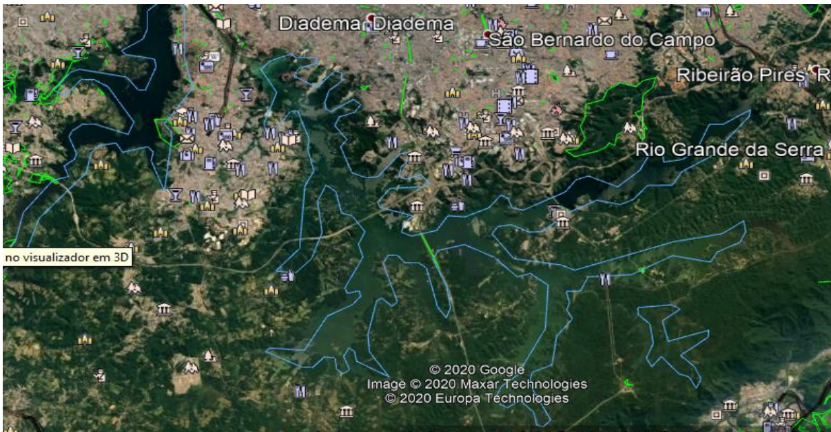
Mapa 1. Região em azul represa Billings.

Complexo Billings + de 70 % de Poluição Verde Tóxica !!! veja www.hftb.com.br .