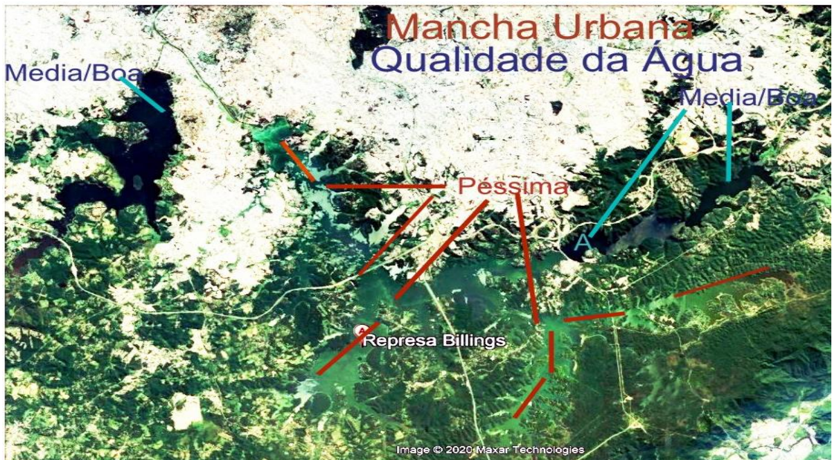
Mapa 2. Mancha Urbana, Serra/Mata Atlântica e Rep. Billings

Veja o comparativo abaixo: Verde fluorescente e tons de verde se destacam da vegetação e terreno.