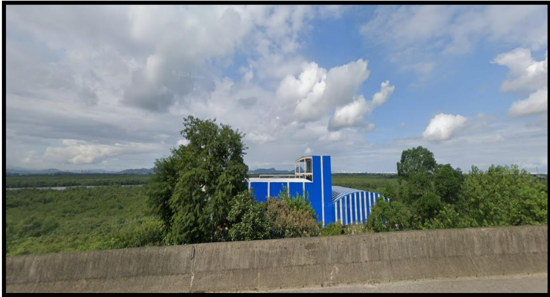
Foto B) Mangue, S. Vicente SP. Instalações, respeitando a legislação Ambiental. Criando postos de trabalho!

Com total consentimento dos órgãos responsáveis municipais, estaduais e federais. E ambas estão em fase de expansão (antes de 2024).