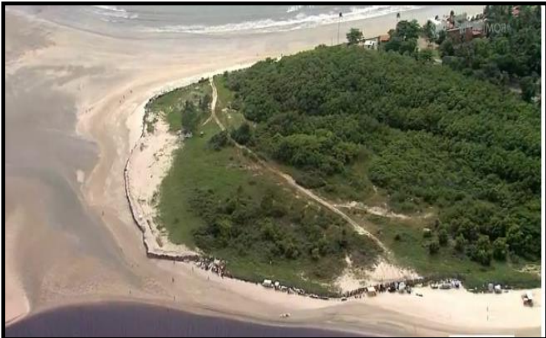
“The Wall PE”, Imagens do G1- Pontal de Maracaípe -PE

Art. 10. As praias são bens públicos de uso comum do povo, sendo assegurado, sempre, livre e franco acesso a elas e ao mar, em qualquer direção e sentido , ressalvados os trechos considerados de interesse de segurança nacional ou incluídos em áreas protegidas por legislação específica.