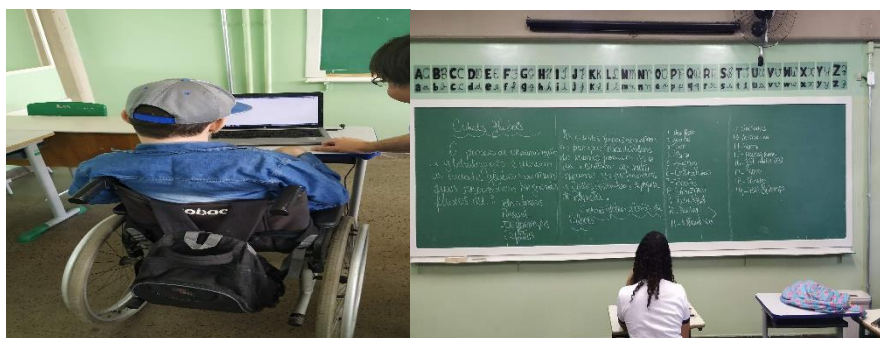
Aula digital (Inclusão) e Aula tradicional, são visões complementares???