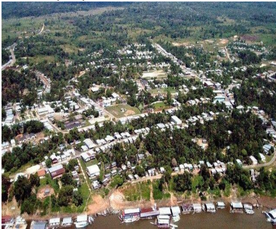
Lábrea (AM), entre os rios Purus e Madeira.