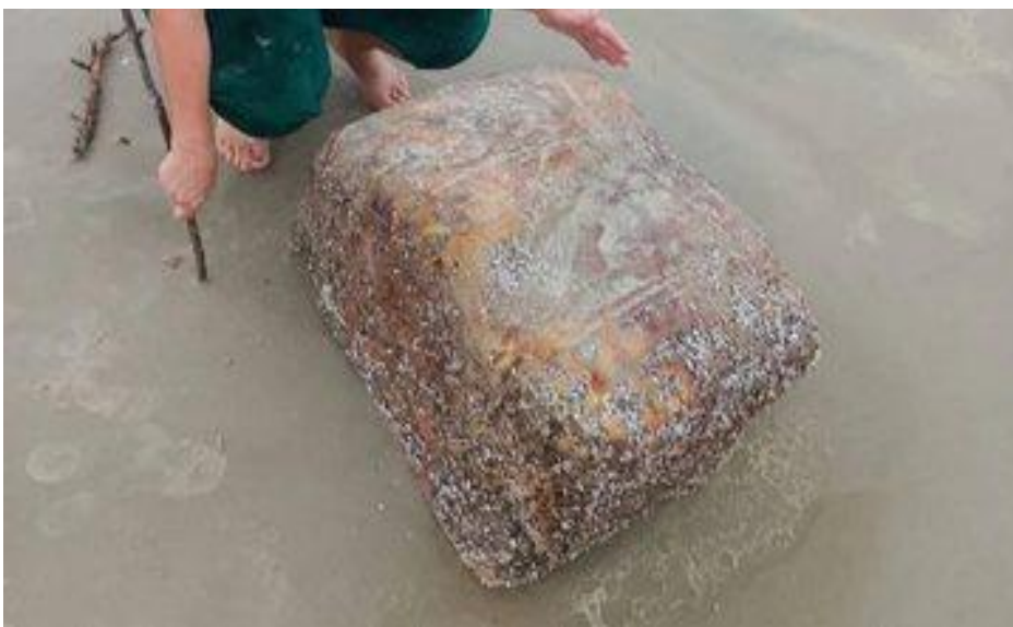
Ilha Comprida –SP .

Foram encontrados, ao longo desta semana, 21 caixas misteriosas contendo placas de borracha de 30Kg, em praias da Ilha Comprida, no litoral sul de São Paulo . Os materiais podem ter se desprendido de navios naufragados durante a Segunda Guerra Mundial. (15/10/2022)