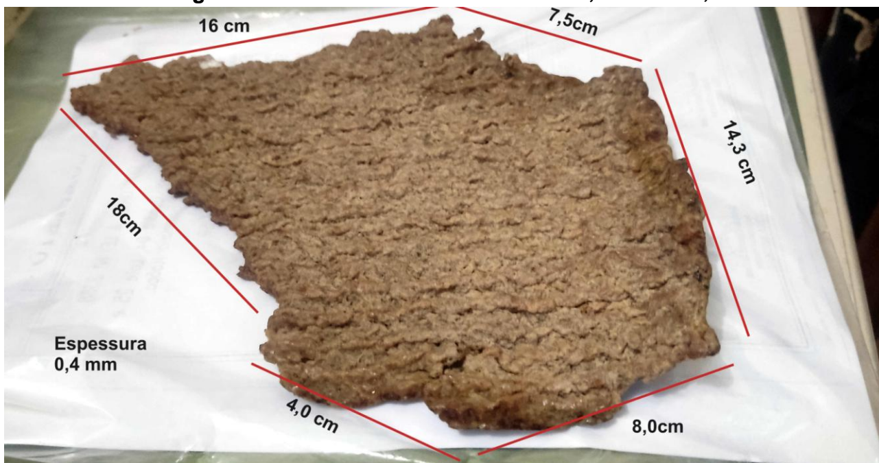
Foto Pschen e Fragmento retirado do bloco de borracha, 25/12/2021, às 17:45.