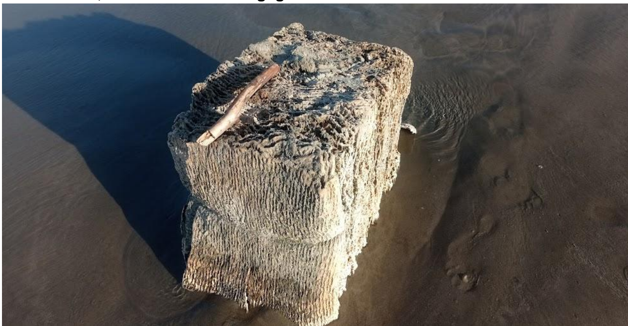
Praia de Itaôca-Mongaguá-SP

Pois sabia na manhã este bloco seria retirado como lixo.