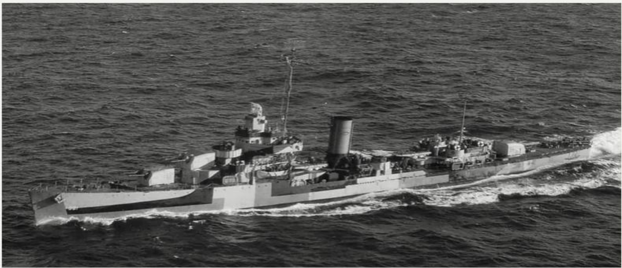
Destroyer USS Somers da Marinha dos EUA (designação DD 381) em patrulha no Atlântico Sul, 1944. Fonte: Wikicommons.

Inscrições em ideograma japonês, o kanji (Fardo de Borracha)| Foto: Claudio Sampaio.